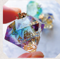
ハートピーツ 5・6日