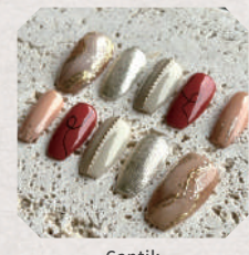
Cantik ~handmade nail tip~ 5・6日