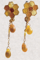
蜂蜜モチーフの レジンアクセサリ 5・6日