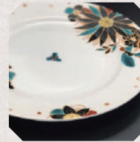
ヤマダのおさら 5・6日