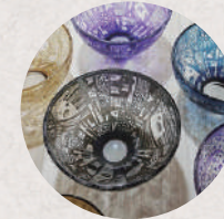
尾藤硝子工房 5・6日