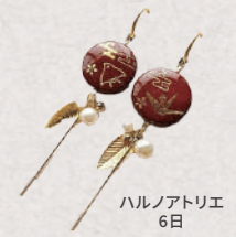
ハルノアトリエ 6日