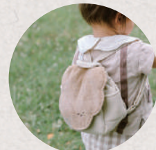
つみきポッシュ 5日