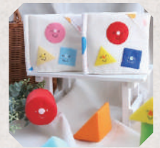
coco ó tete 5日