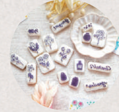
イロドリハンコ 5日