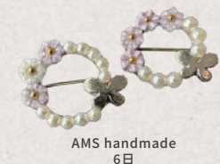
AMS handmade 6日