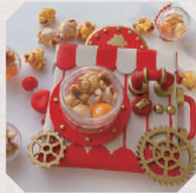
壺屋のおもちゃ屋 6日