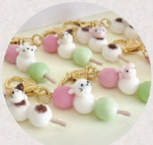
Fake sweets shop Sugar.e 5・6日