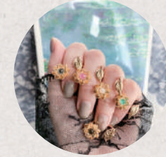
【耳元を彩る美術館】monet* 5日