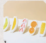
FRUIT SWEETS ChouChou 5・6日