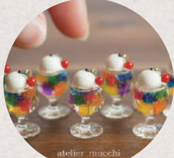
atelier mucchi 5・6日