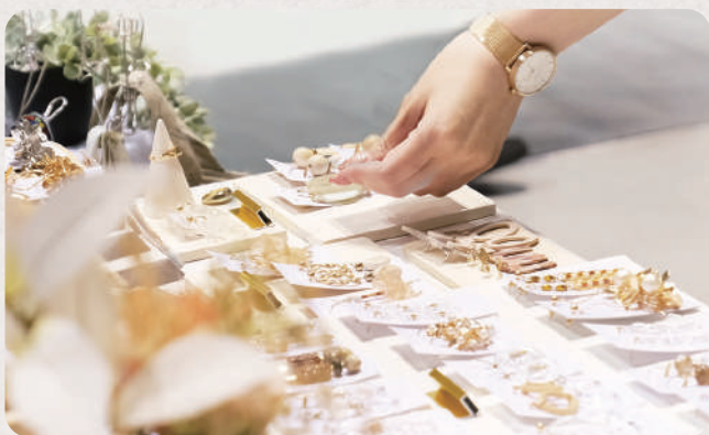
実際に作品を手にとって見ることができます