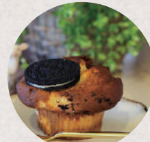
chouchou muffin 5・6日