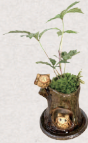
ぼてぼん工房 5・6日