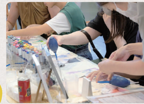
お子様はもちろん、大人も夢中になって楽しめます