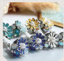
Sunny Sky 5・6日