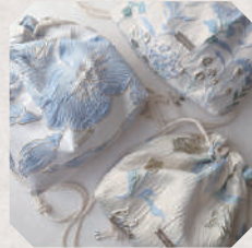
calm room 5・6日