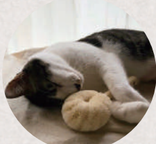
手づくりたわし北山正積商店 5・6日