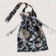
meeets & Lino+ 5日