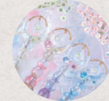
届けたいのは「大丈夫」の魔法♡ 魔法のステッキ屋さん 5・6日