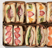
サンドイッチ専門店 ミスターシェフ 5・6日