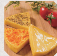
徳島スモーク 5・6日