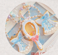
フェイクスイーツアクセサリ 5・6日