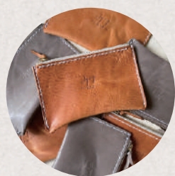
aging Leather Works 5・6日