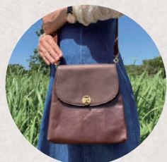
Atelier Altair 5・6日