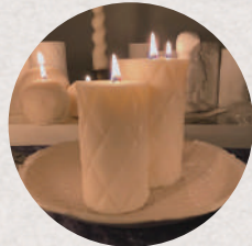
sen candle 5・6日